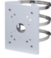
A36 POLE MOUNT