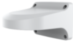
A29 A29 WALL MOUNT