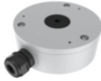
TC-P54BM SPEC: V5 JUNCTION BOX