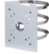
A36 POLE MOUNT