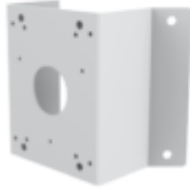
A35 CORNER MOUNT