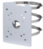
A36 Pole Mount