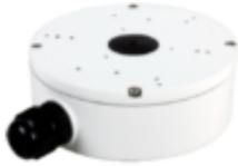
A22 Junction Box