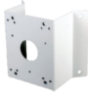
A35 Corner Mount