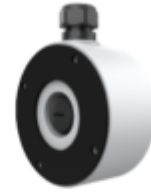
TC-P54AM Spec:V4 Junction Box